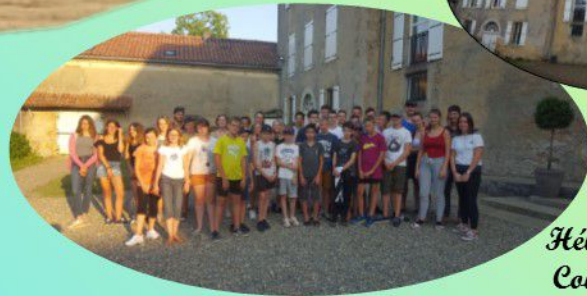
Hébergement au Château de Couloumé-Mondébat (32)